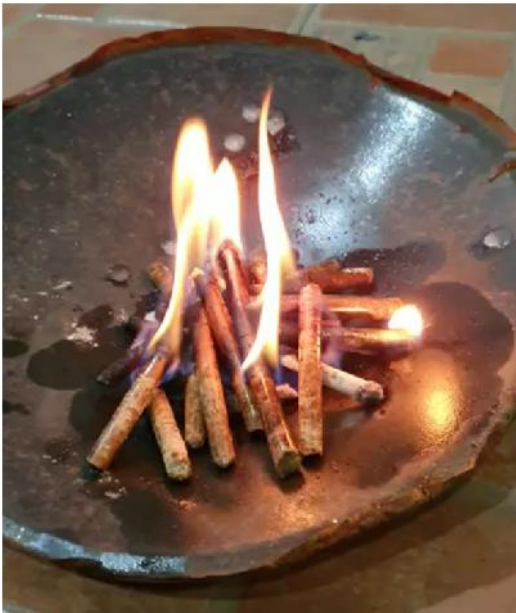
Pellet Sekam Padi